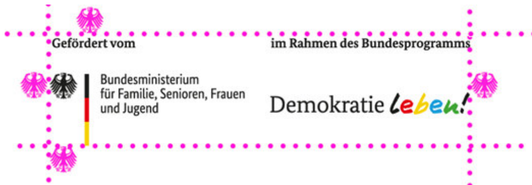
Illustration: Schutzraum um das Logo

in der kein anderes Element platziert werden darf. Die Schutzzone hat zu jeder Seite hin die Breite von einem Adlerelement.